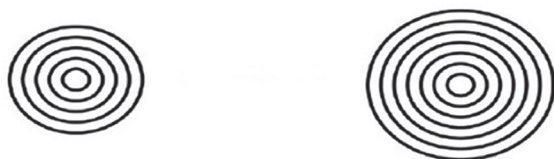
Figura 1 Representação da estrutura produtiva conhecida como mosca alvo

Fonte: Elaboração própria adaptado de BÖHM-BAWERK. A Teoria Positiva do Capital . p. 133-34.